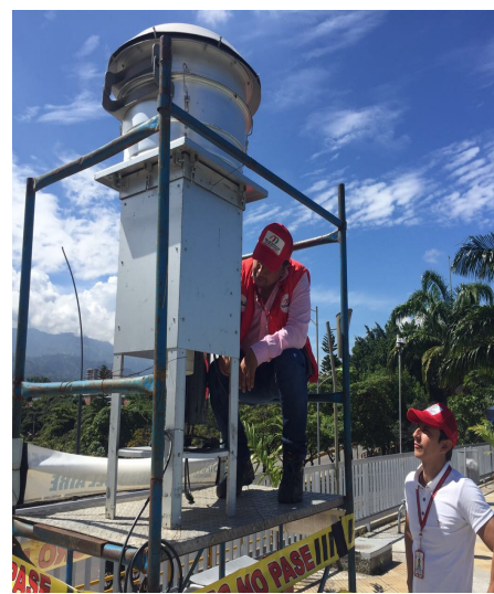
Imagen 2. Estación Puerta del Sol