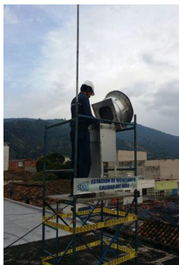
Imagen 1. Estación Calle 10 Con Carrera 9 Piedecuesta

Si bien en el Área Metropolitana de Bucaramanga no estamos superando los niveles permisibles diarios, estamos muy cerca de los límites anuales, por lo que debemos trabajar en la construcción de un plan para la disminución de estas concentraciones.